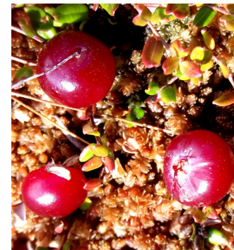
Tranbär / Moosbeeren (11)

(11) Ein kleines naturbelastetes Hochmoor liegt 50 m rechts. Es hat eine in Deutschland extrem seltene Vegetation, z.B. Glocken- und Rosmarinheide, Sonnentau, Moos-, Rausch- und Moltebeeren. Auch ohne Stiefel kann man bis an einen Hochsitz gelangen und fühlt sich wie in der Wildnis.