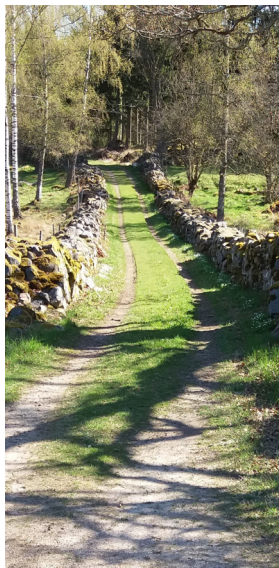
Stengärde/ Lesesteinriegel (5)