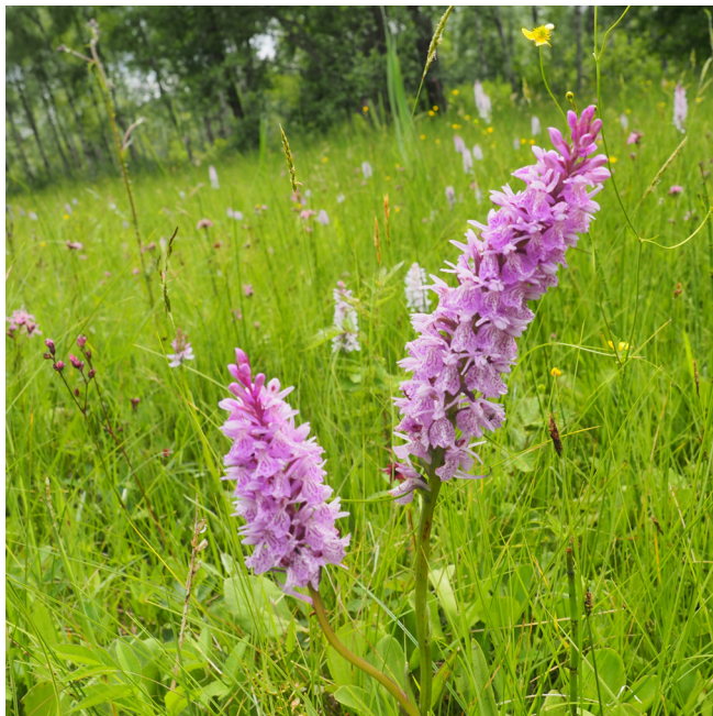
Jungfru Marie nycklar / Geflecktes Knabenkraut, Kylan (12.1)