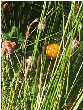
Hjordron / Moltebeere (11)