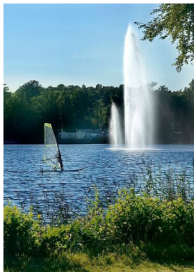
Fontän, Osbysjön (1)