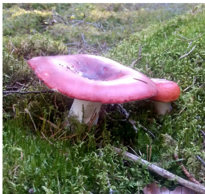
Kremla / Täubling

(12.2) Resterna av "Bostället" (omnämnt sedan 1570) finns strax före bron över Simontorpaån. I vägkanten står en informationstavla.