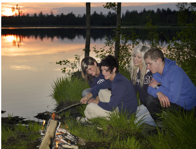
Kanske ta det lugnt och övernatta? (9) Wie wär's mit einer Übernachtung? (9)

Turen börjar och slutar vid järnvägsstationen i Osby. Den är inte markerad och om papperskartan inte räcker för orientering kan du ladda ner rutten i appen Bikemap från bikemap.net . När du har öppnat vald tur kan du följa den med GPS utan internetuppkoppling.