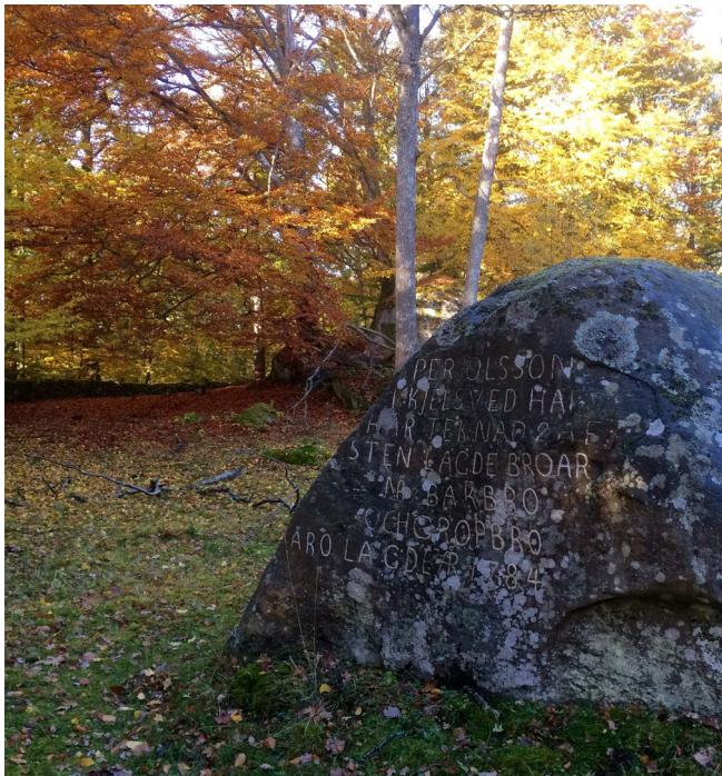
Kälsvedstenen / Kälsved-Stein (5)