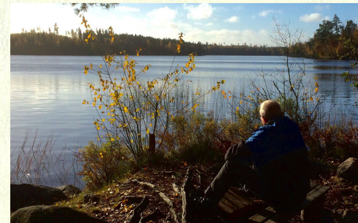
Vildmarkskänsla / Wildnis erleben, Örsjön (12)