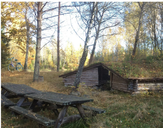
Rastplats vid kvarndammen / Rastplatz am Mühlteich (9)