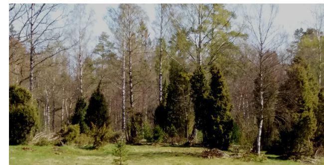
Enhage / Wacholderweide (7)

Start und Ziel dieser Tour ist der Bahnhof in Osby. Der Verlauf ist nicht markiert, und falls die Papierkarte zur Orientierung nicht ausreicht, kann man sich die App Bikemap von bikemap.net herunterladen. Nach dem Download der Tour können Sie sich auch ohne Internetverbindung per GPS orientieren.