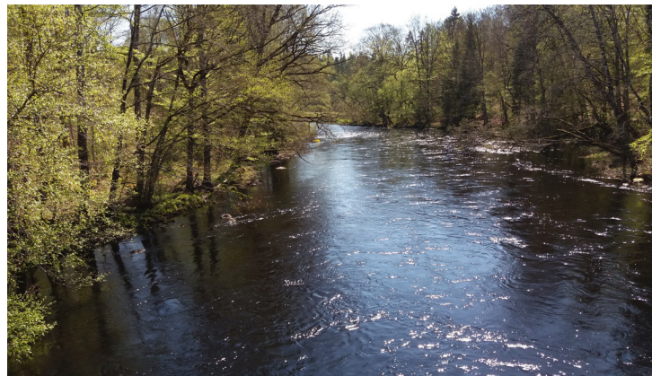
Helge å, vid kanotlägerplatsen / am Rastplatz für Kanufahrer (3)