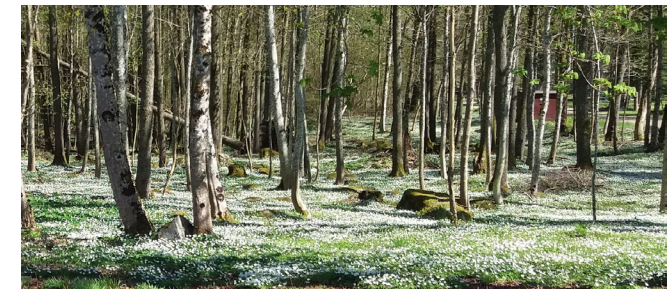
Vitsippor / Buschwindröschen, Malshult (9)

Start und Ziel der Tour ist der Bahnhof in Osby. Ihr Verlauf ist nicht markiert, und falls die Papierkarte zur Orientierung nicht ausreicht, kann man sich die App Bikemap von bikemap.net herunterladen. Nach dem Download der Tour können Sie sich auch ohne Internetverbindung per GPS orientieren.