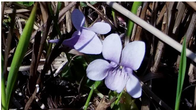
Kärrviol / Sumpf-Veilchen, Skeingesjön (5)