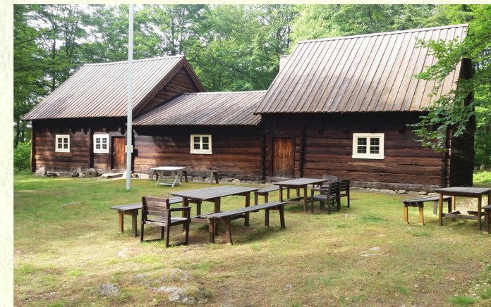
Stavshultsgården (10 b)