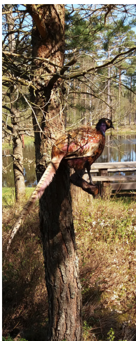
Fasan, Fattigullarp (1)