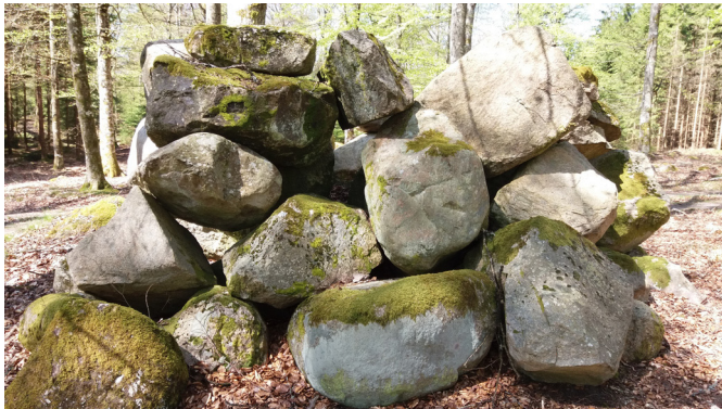
Odlingsröse / Lesesteinhö (4)

Turen börjar och slutar vid järnvägsstationen i Osby. Den är inte markerad och om papperskartan inte räcker för orientering kan du ladda ner rutten i appen Bikemap från bikemap.net . När du har öppnat vald tur kan du följa den med GPS utan internetuppkoppling.