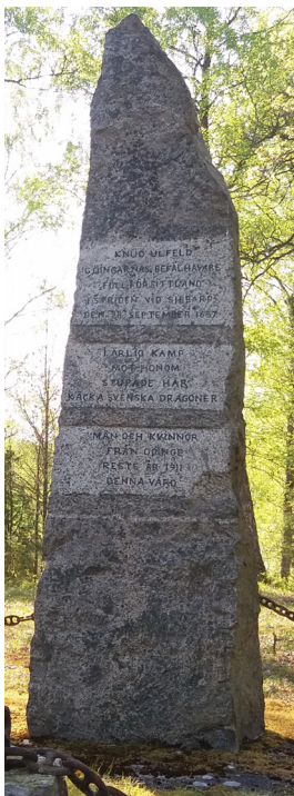
Monumentet Gedenkstein (10 a)

(8) Malsjön är en liten sjö som ligger inom ett Natura 2000-område och är omgiven av vidsträckt betade fuktängar (ekursionsmål för Lunds universitet). Här växer den fridlysta klockgentianan (blommar under sensommaren) och kryddväxten pors (massförekomst). Om taggrådsgrinden är öppen kan du lätt cykla fram till stranden (ca 100 m), där det finns ett rastbord med grill, och njuta av den fina utsikten.