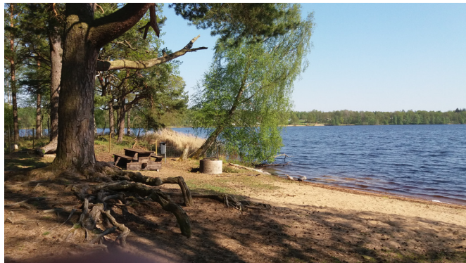
Bad(e)strand, Svarte nabbe (12)

(12) Svarte nabbe är en vacker fårbetad halvö. Du måste öppna en liten grind för att komma fram till nabbens spets. Här finns en liten fin badplats med sandstrand och en mäktig gammal tall med frispolade rötter.